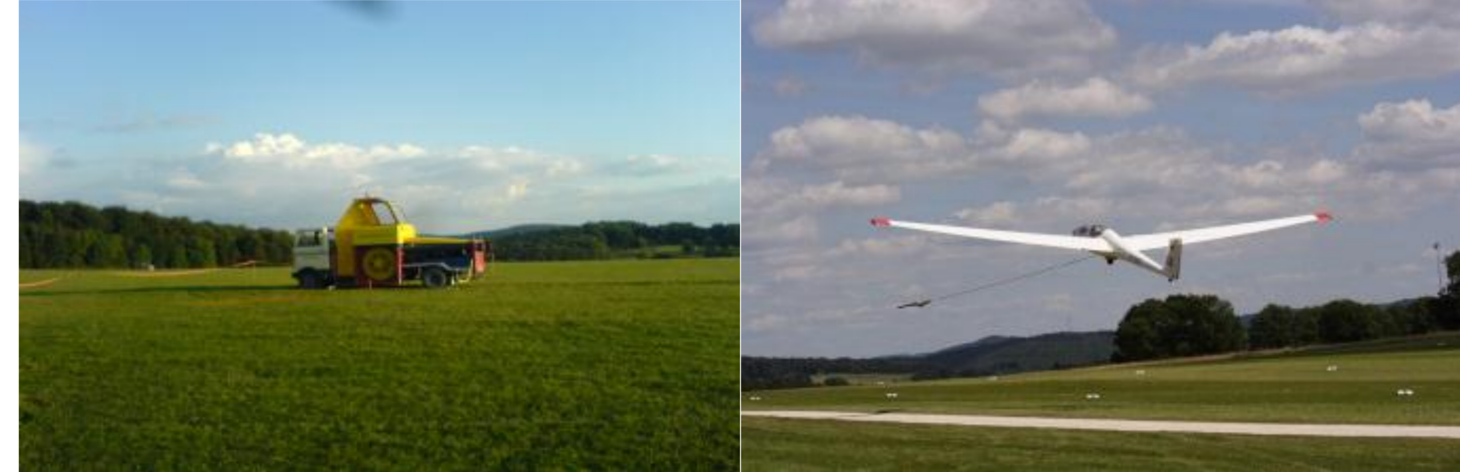
Windenstart bei der Akaflieg Tübingen mit dem Schulungsflugzeug ASK 21

Start: Eine 300 PS starke Seilwinde gibt dir eine Starthöhe von 400 Metern – Vor dir liegen 8 Stunden Abenteuer und Du bist der Regisseur!