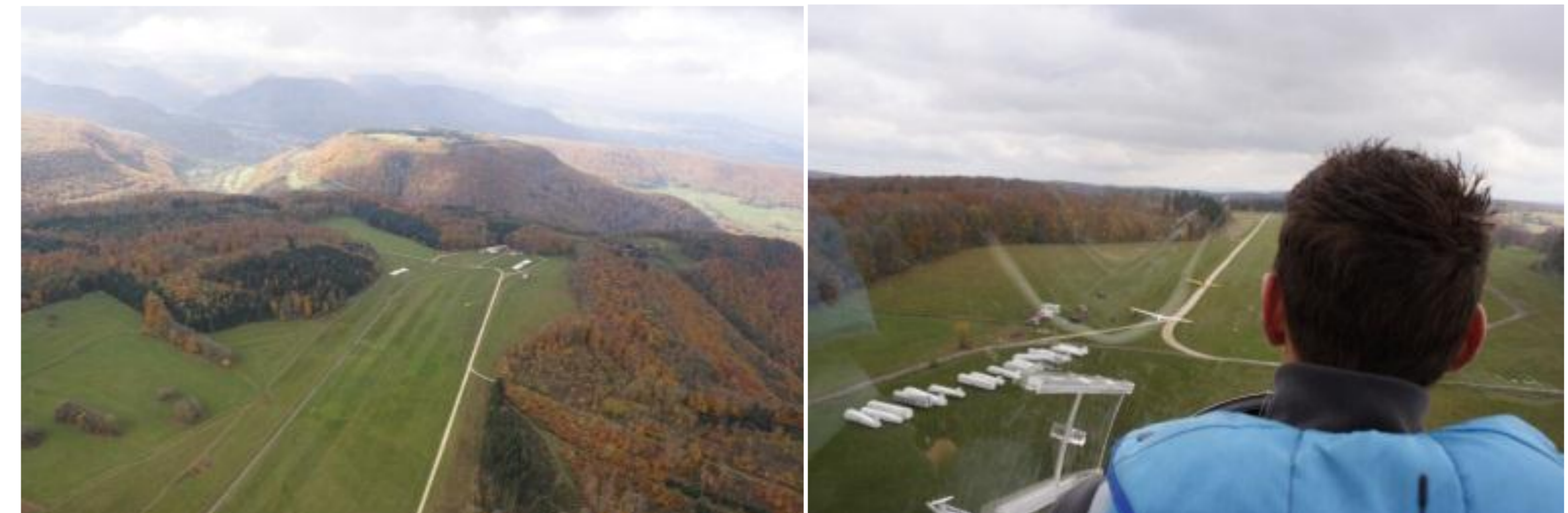
Flugplatz Übersberg bei Reutlingen

Der Flugplatz Übersberg liegt am Albtrauf bei Reutlingen. Es bestehen Mitfahrgelegenheiten von Tübingen aus.