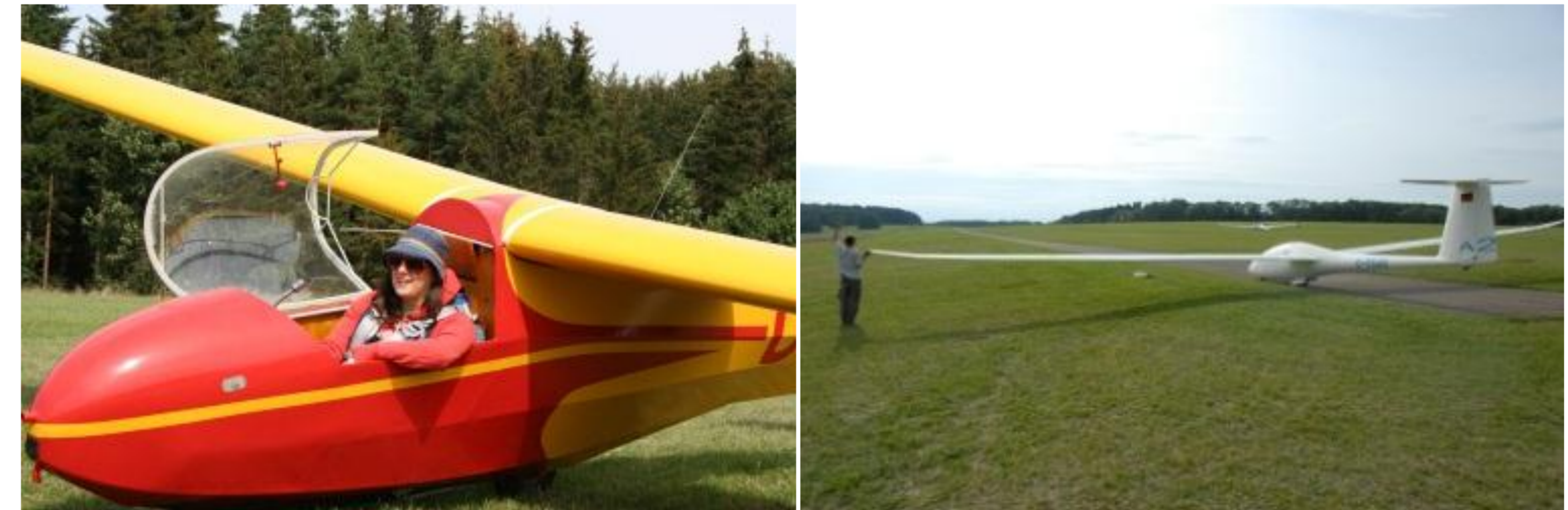
Vom Oldtimer „KA 8“ (links) bis zum Hochleistungssegler „DUO Discus“ (rechts)

Die Akaflieg Tübingen verfügt über einen modernen und vielseitigen Flugzeugpark.