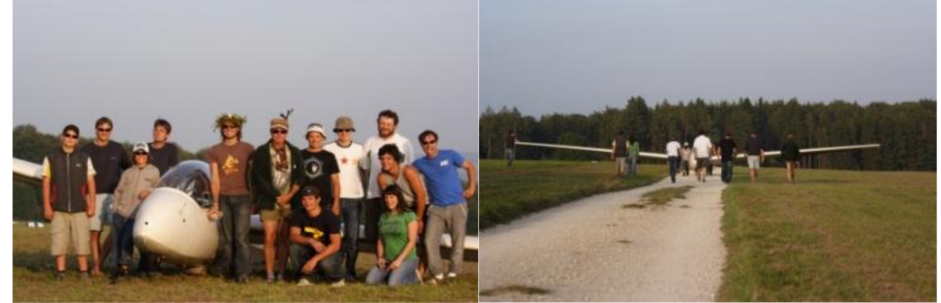
Die ersten drei Alleinflüge werden traditionell, gemeinschaftlich gefeiert

Segelfliegen ist ein Teamsport. Unsere Gemeinschaft ist stark durch eine homogene demografische Struktur und eine gute Stimmung.