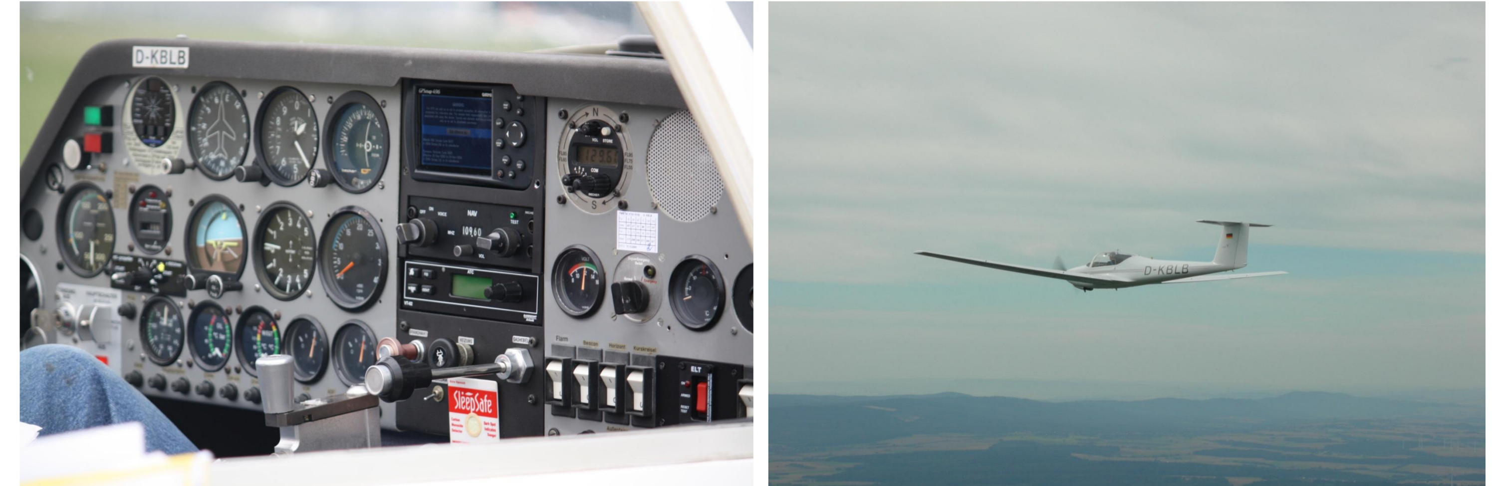
Cockpit der Taifun E, ein Motorsegler der 1. Klasse